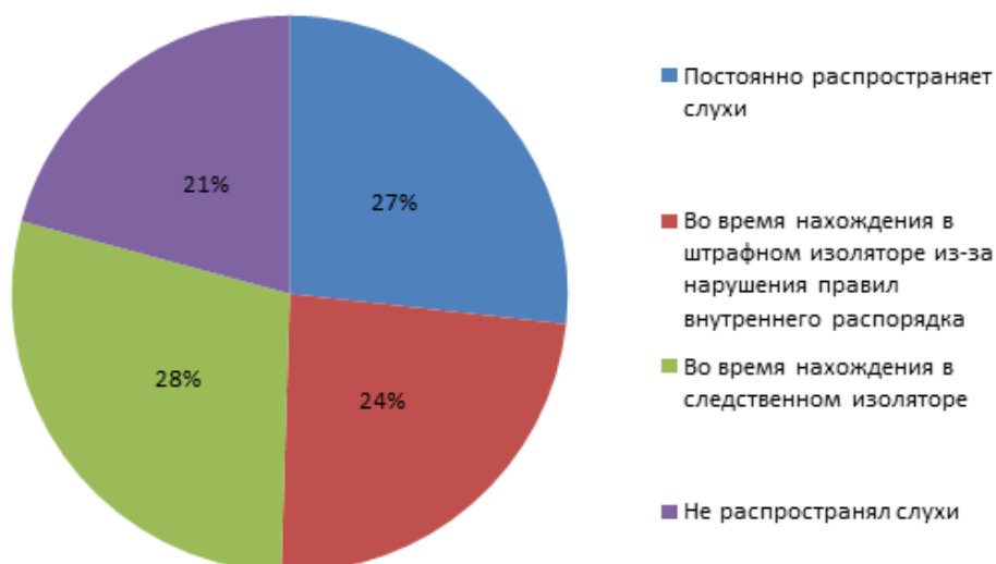
Рис. 2. Распространение слухов о самоубийстве